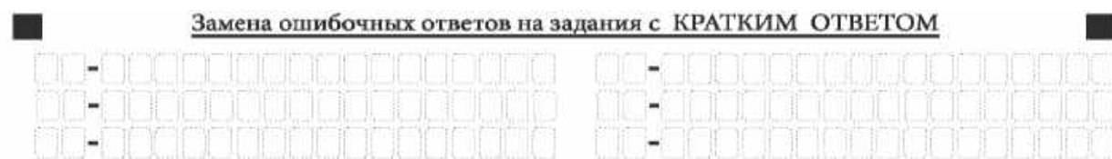
Рис. 10. Нижняя часть бланка ответов № 1 (поле замены ошибочных ответов на задания с кратким ответом)

В нижней части бланка ответов № 1 предусмотрены поля для записи исправленных ответов на задания с кратким ответом взамен ошибочно записанных (рис. 10).